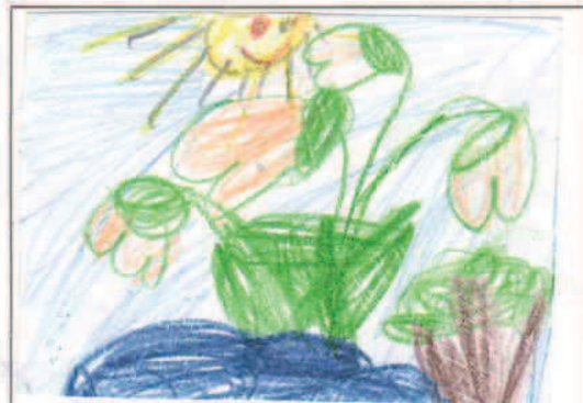
Bara Laura I. oszt.