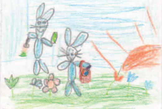
Gál Ödön elők. oszt.

REJTVÉNYBEKÜLDŐ SZELVÉNY: TÖLTSD KI, VÁGD KI, ÉS TEDD BE