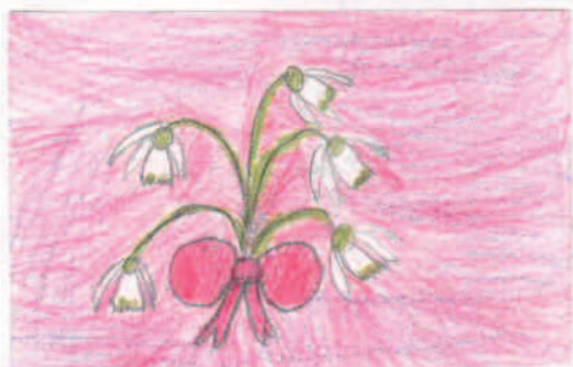
Both Csilla IV. oszt.