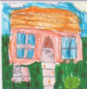
Molnár Zselyke elők. oszt.