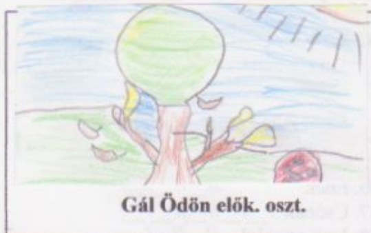
Gál Ödön elők. oszt.